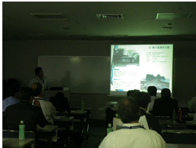
「平成27年度ソフィール実績紹介」

ソフィール協会として、今年度はエコプロダクツ2016の展示会（平成28年12月8日～10日、ビッグサイト）に出展し、社会に貢献できる新技術を積極的に提案していきます。