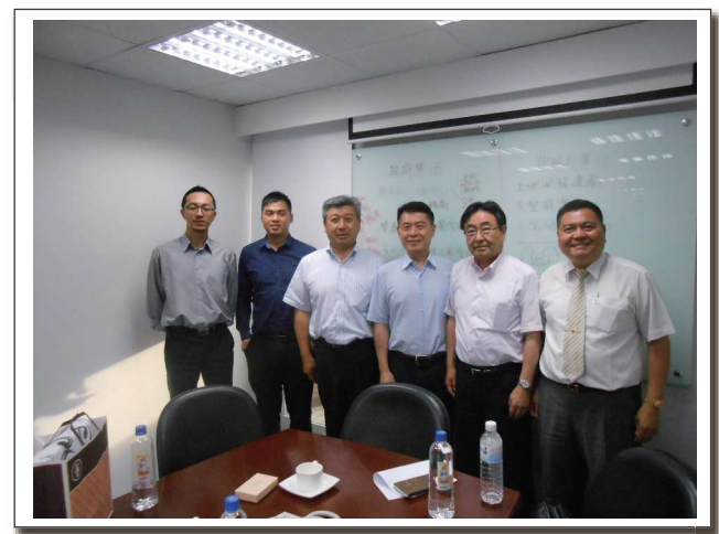
MWH事務所にて記念撮影

ソフィール協会会員の光建設株式会社、株式会社沖創工およびアルコ株式会社は、台湾企業の致泰企業有限公司、MWHと連携して台湾でソフィール事業を展開することに合意しました。台湾での事業開発を具体的に進めるために、6月16日～18日にアルコ株式会社が台湾で打合せを行いました。また、明志科技大学の崔副教授とも面談し、実証実験の協力を確約いただきました。