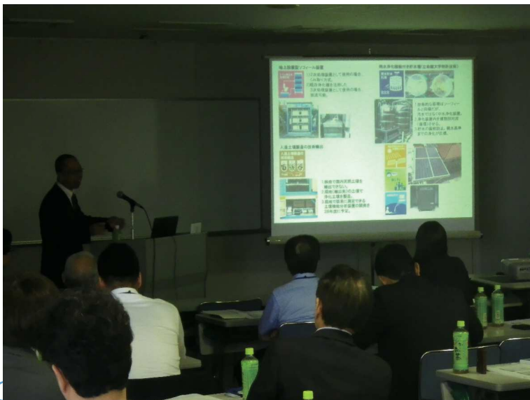
「新連携の取り組み状況報告」