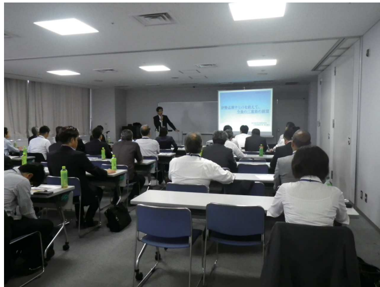
講演会「伊勢志摩サミットを終えて今後の三重県の展望」