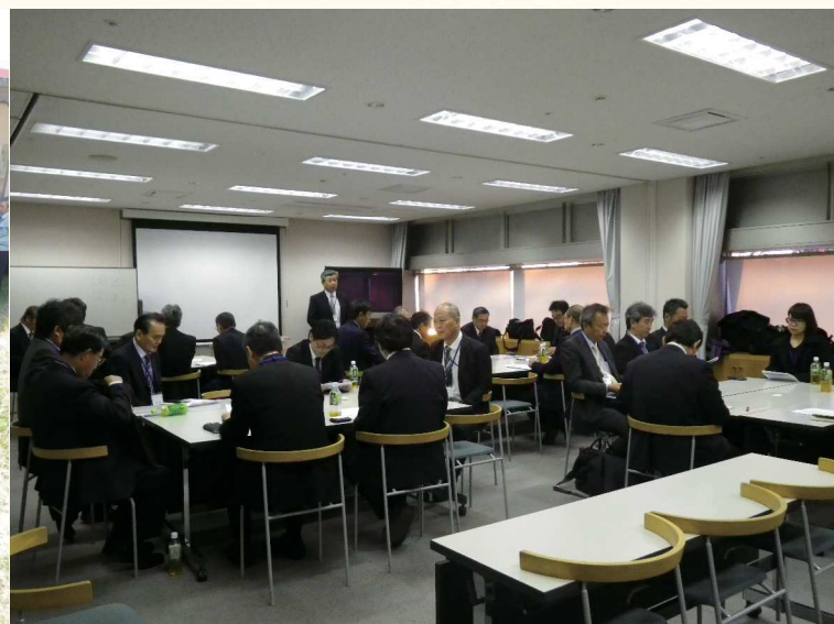
研修会風景(参加者情報交換)