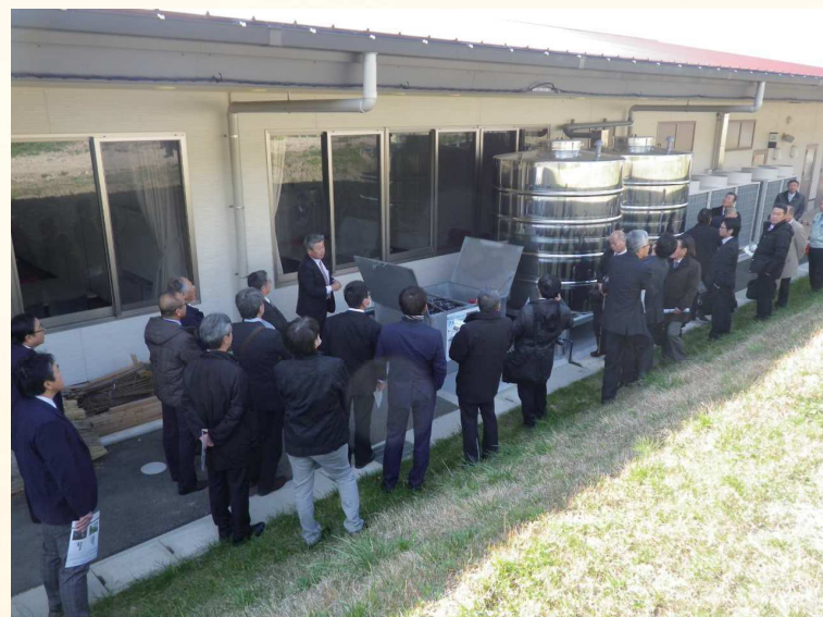
雨水貯水・活用システム「アメリオ」実証実験現場視察