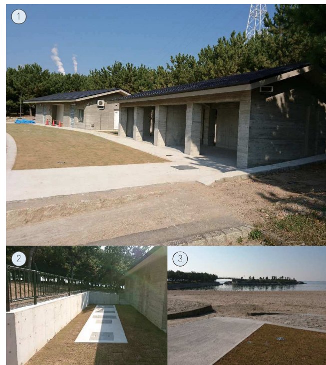
① トイレ建屋 ② 処理装置 ③ 周辺風景

場所：兵庫県高砂市高砂町向島町 施工年月：2017年8月 人 槽：192人槽 汚水量：10.2m 3 /日 発注者：兵庫県 東播磨県民局 仕 様：処理水循環利用